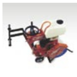
Einfache Blattmontage. Feststellbremse.